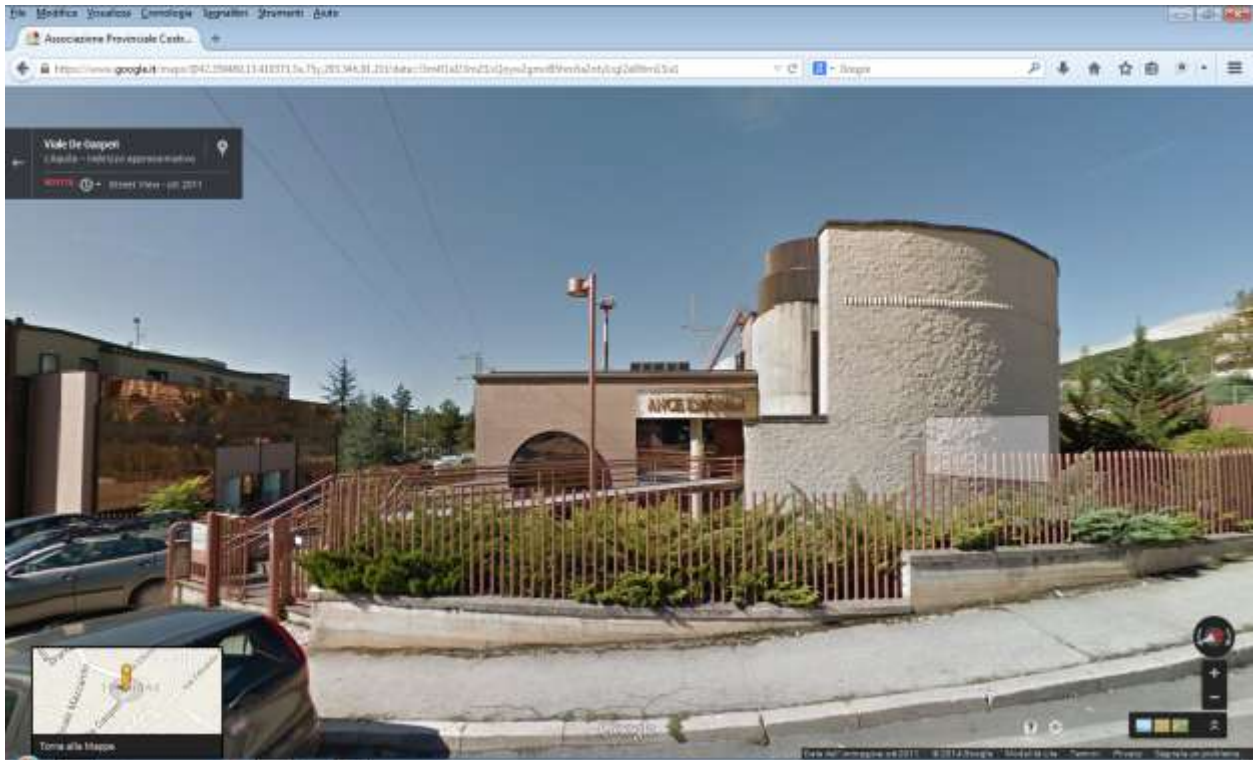
ANCE DI L'AQUILA - VIALE DE GASPERI, N. 60 - 67100 L'AQUILA